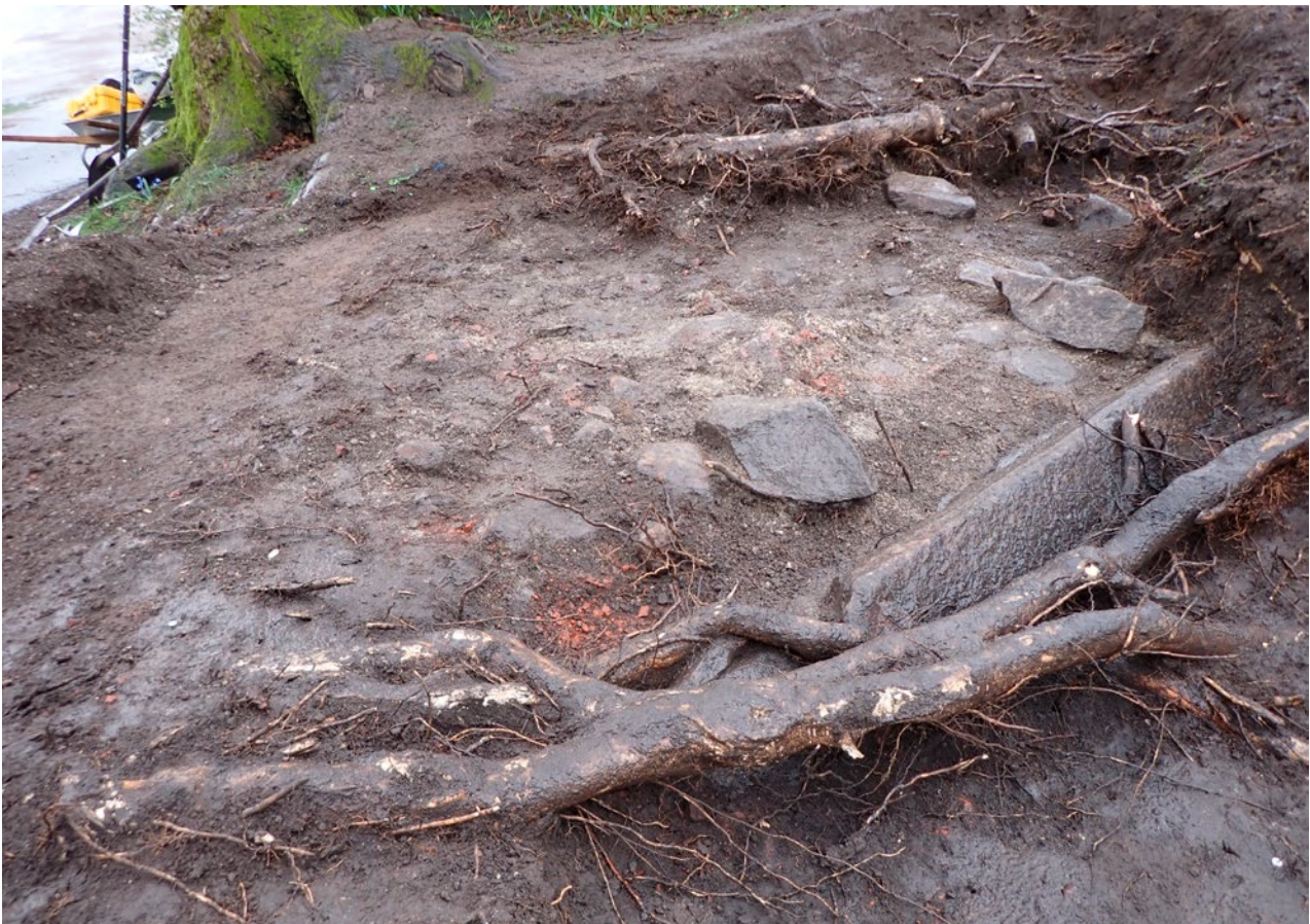
Figur 4. Den påträffade skalmuren, med stenläggning bestående av kalkbruk, tegelbitar och större stenar, några huggna. En större avlång huggen kvadersten på den norra sidan. Foto mot SV, (Fotonummer: 2023-84-1).