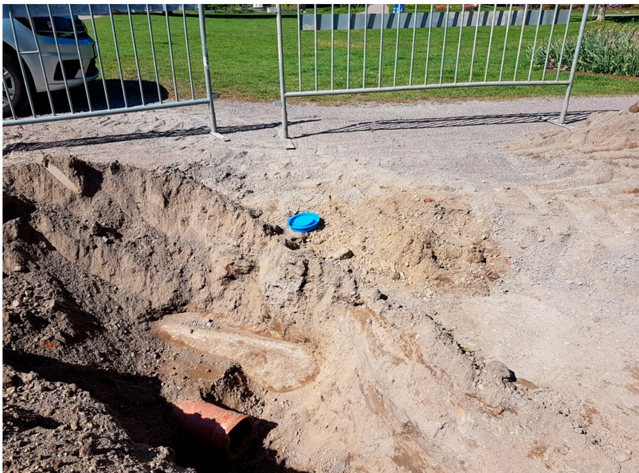
Figur 5. Den huggna kvaderstenen som troligen tillhör stembären. Foto mot väst.