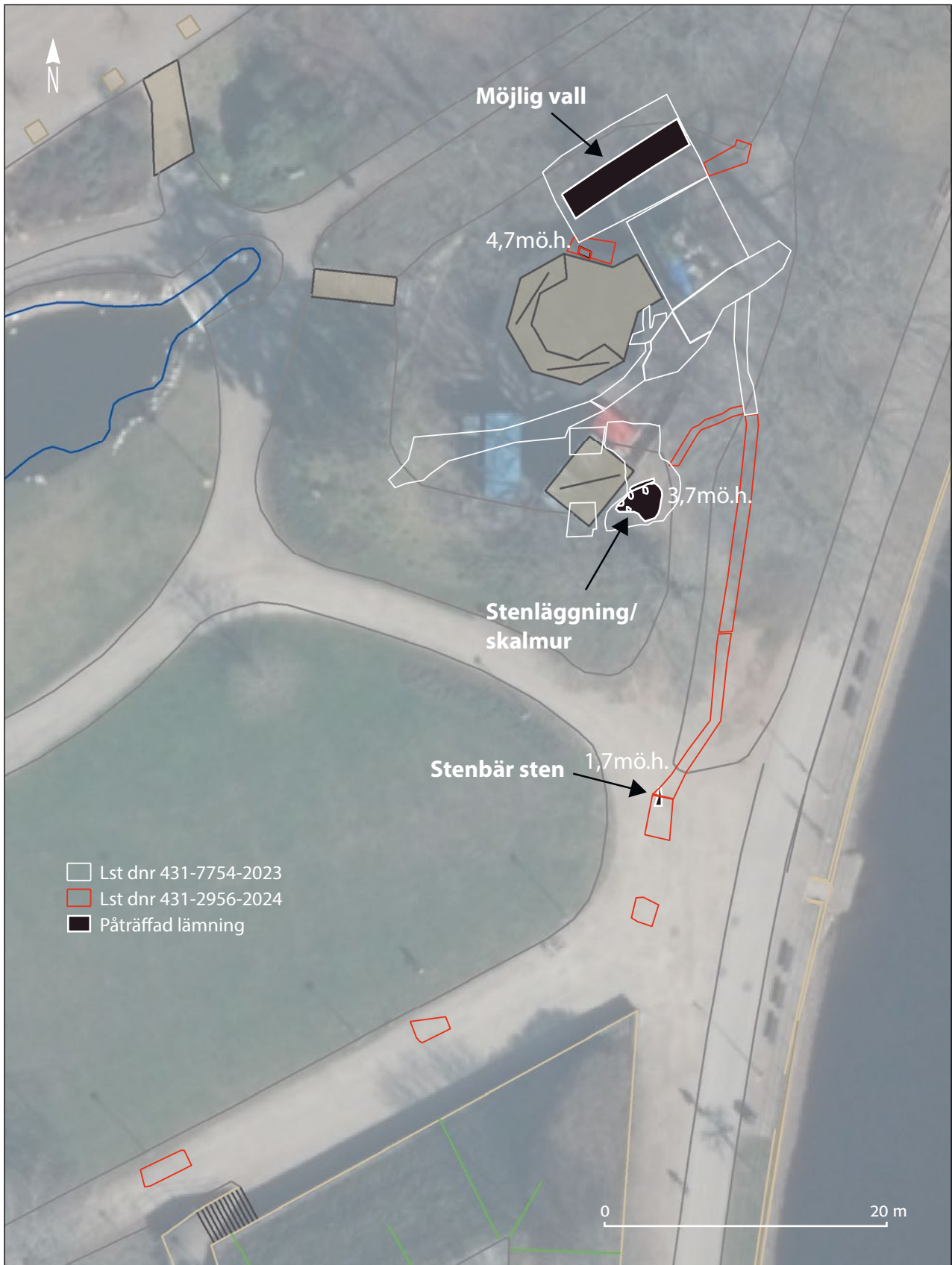
Figur 2, Alla schaktade ytor med påträffade lämningar. Skala 1:400.