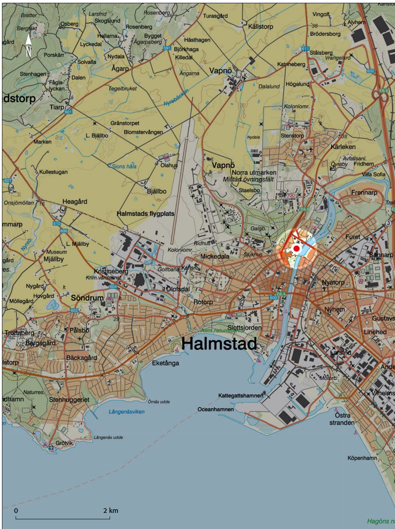
Figur 1. Undersökningsområdets läge markerat på Lantmäteriets karta. Skala 1:50 000.