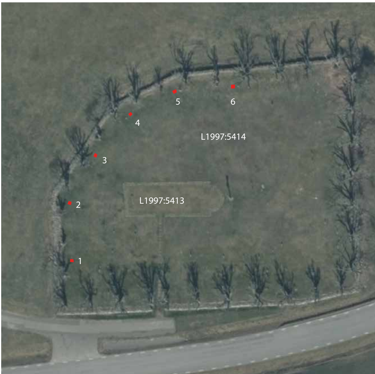
Figur 3. De sex trädgroparna markerade på ortofoto. Skala 1:500.

Sex trädgropar, med måtten cirka 0,6x0,6 meter, gräv-des för hand ned till mellan 0,3–0,4 meters djup. Gro-parna grävdes längs kyrkogårdens västra och norra sida och deras exakta placering framgår i figur 3.