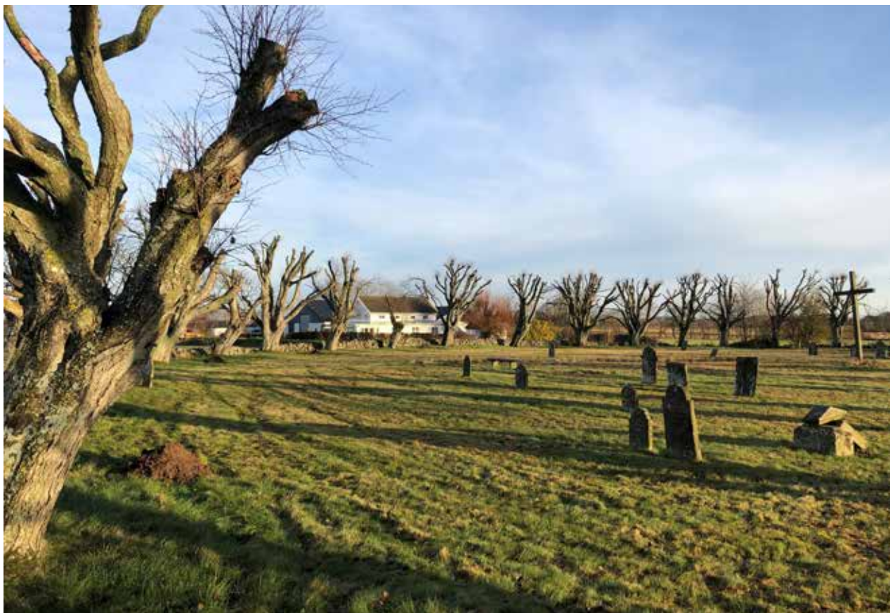
Figur 4. Trädgropar längs västra och norra muren. Närmast i bild är groparna grop 2 och 3, mot NO. Fotonr: 2024-91-1.

I groparna påträffades matjord, rötter, sten och enstaka fragment av tegel och bruk. Troligen härrör de enstaka tegelfragmenten och bitarna av bruk från den gamla kyrkan. Efter att den rivits kan fragment spritts på kyrkogården tillsammans med jordmassor i utplanande syfte. I grop 5 påträffades ett fragment av en tegelplatta (se figur 5 och 6). Färgen är mörkbrunrå och den är 11,5 cm lång, 6,5 cm bred och 1,5 cm tjock. Ovansidan är fasad längs långsidan och längsgående avstrykningar syns, medan tvärgående avstrykningar syns på den fasade kanten. Undersidan är gråbeige och ser ut att vara doppad i sand. Kärnan i plattan är brunorange. Den brända leran är magrad. Föremålet mättes in som lösfynd. Fyndet har erhållit accessionsnummer VM300 135:1. Möjligen härrör tegelplattan från någon form av utsmyckning som satt på den ursprungliga kyrkan.