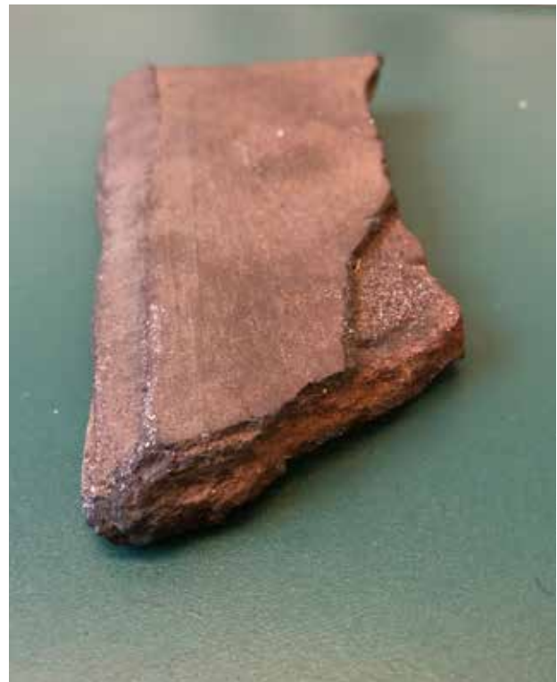
Figur 6. Det bearbetade tegelfragmentet i grop 5. Fotonr: 2024-91-6.

Intrasisid: 222 Storlek: 0,6 x 0,6 meter Djup: 0,3–0,4 meter Fyllning: Brunsvart sandig matjord och rötter. Fyllningen är något ljusare och sandigare i karaktären än vad den är i de övriga trädgroparna.