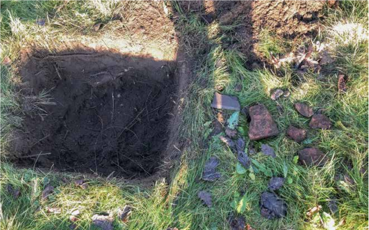
Figur 5. Grop 5 samt påträffade tegelfragment och bruksbitar upplagda i gräset brevid, mot N. Fotonr: 2024-91-5.